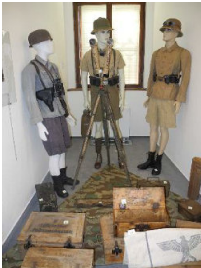
Kromě drobnějších předmětů byly k vidění i dobové uniformy

Výstavu během necelého měsíce zhlédly více než tři stovky lidí. Hojně byla navštívena i během nočních prohlídek, kdy možnosti prohlédnout si výstavu využila drtivá většina ze čtyř set návštěvníků večerního programu.