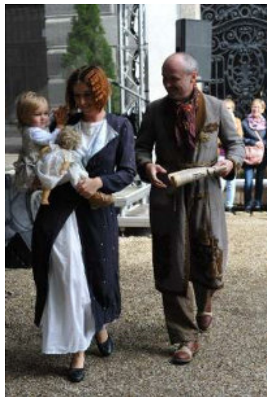
Dobové módní přehlídky