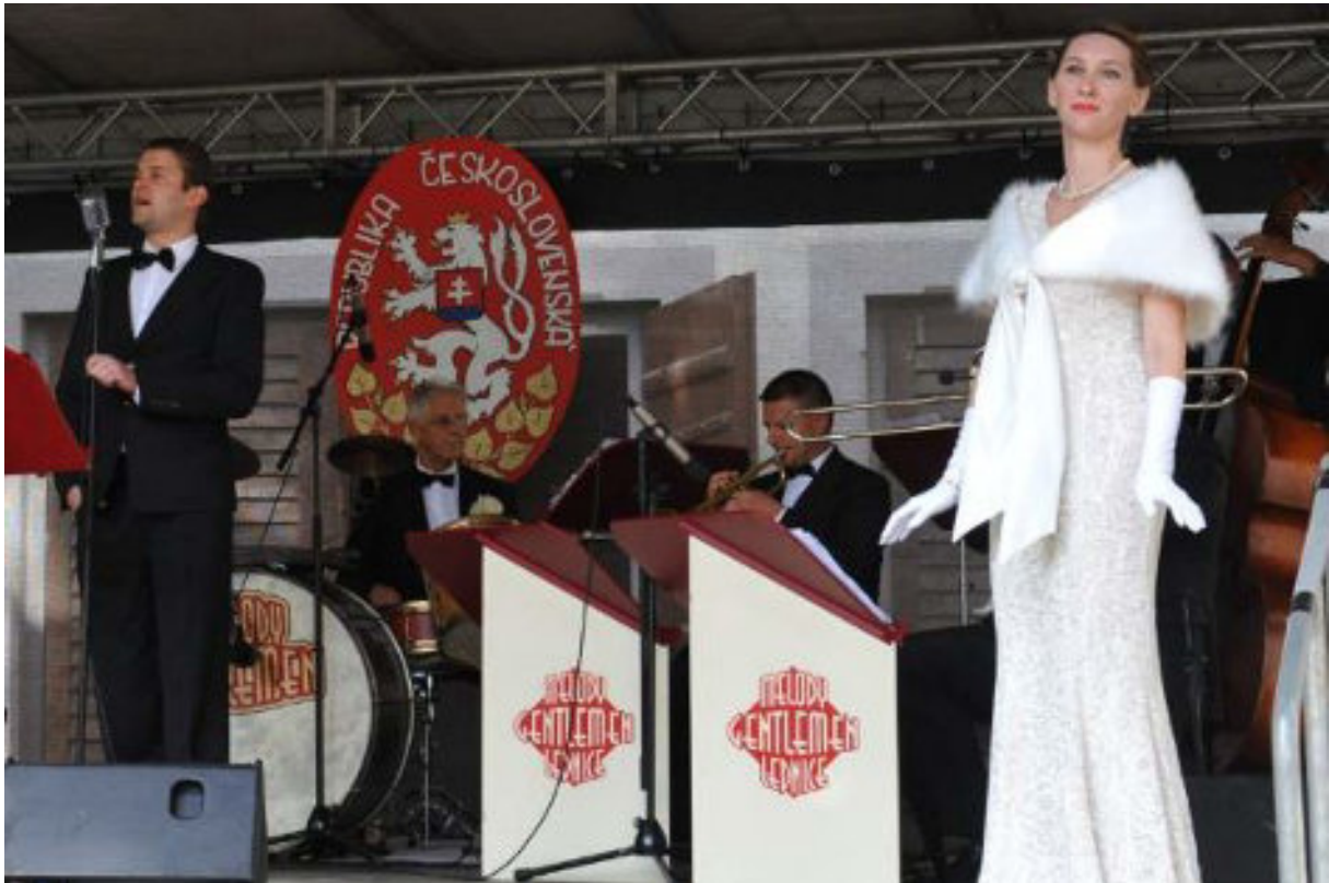
Swingové melodie v podání Melody Gentlemen Lednice