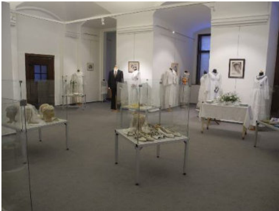
Vystaveny byly i svatební doplňky či fotografie

Tematika odívání a svateb byla pro návštěvníky muzea zajímavým a lákavým zpestřením. Výstavu si prohlédlo téměř osm set lidí.