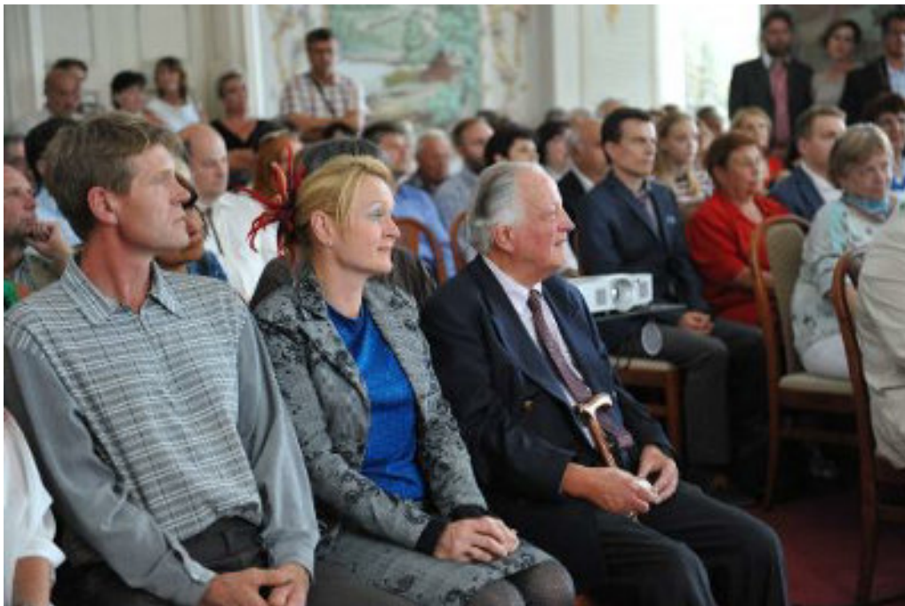
Slavnostní zahájení v zámecké jídelně