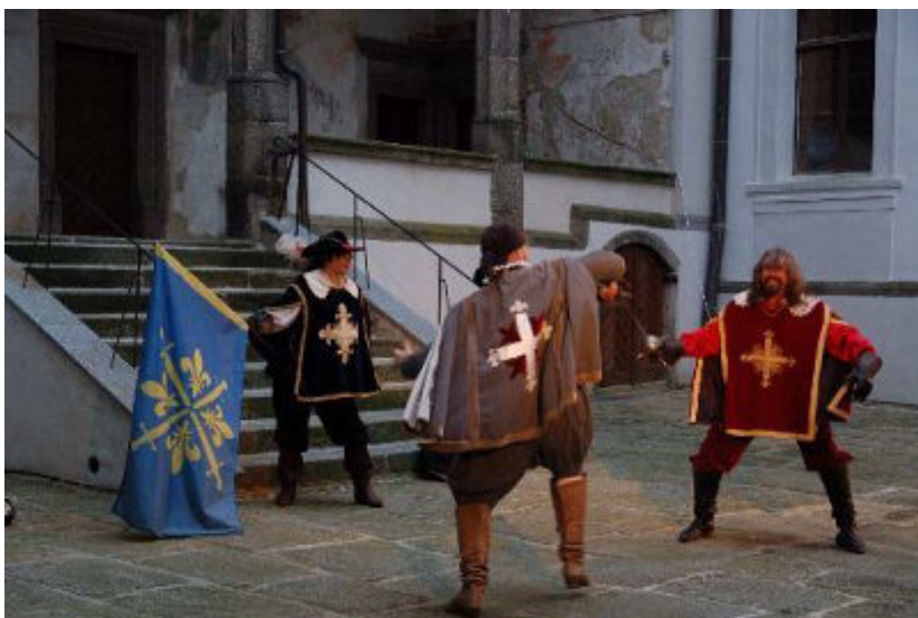
Šermířský a kejklířský program se uskutečnil na vnitřním nádvoří

Po skončení představení už záleželo na každém, zda bude nejdříve pokračovat do stálých expozic, nebo zavítá na výstavu o konci druhé světové války ve Velkém Meziříčí.