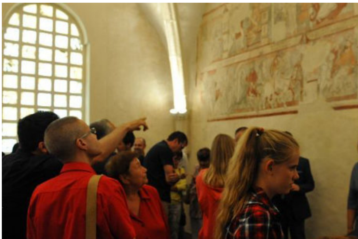
Prohlídka zrestaurovaného sálu během slavnostního otevření