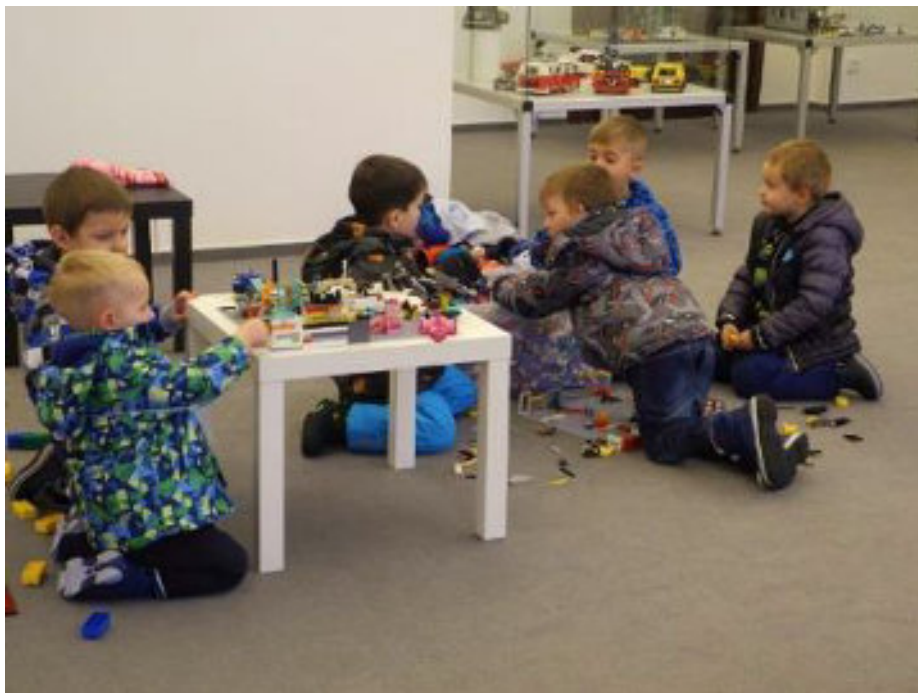
Součástí výstavy byl i dětský herní koutek

Ve výstavní sále byl připraven i dětský koutek, kde si děti mohly z připravených kostiček skládat dle vlastní fantazie.