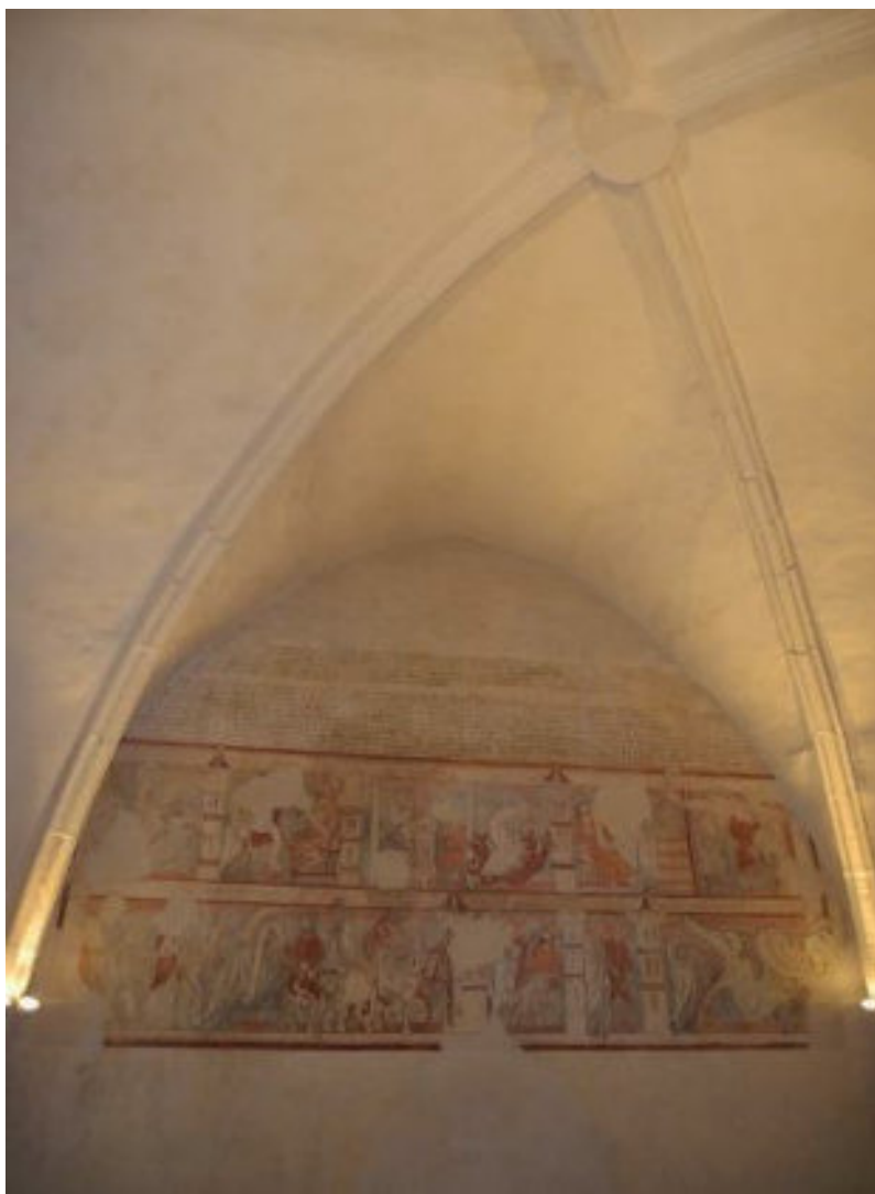
Pohled na legendu svaté Markéty

Po úvodu v zámecké jídelně se pak všichni přesunuli do rytířského sálu, aby si mohli fresky prohlédnout. V případě zájmu byli v sále přítomni pracovníci muzea, aby mohli zájemcům podat zodpovědět případné dotazy. Majitelé objektu výjimečně zpřístupnili také zámeckou kapli a terasu s výhledem na město.