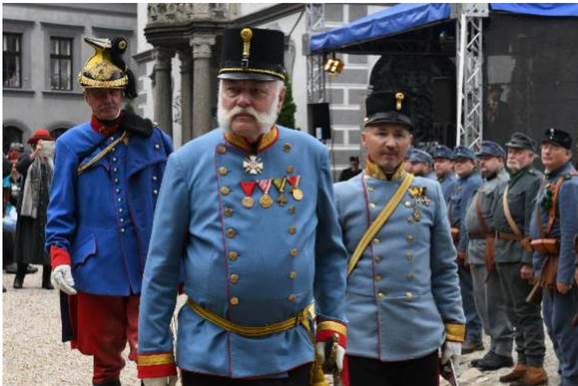
Císař František Josef I. při nástupu vojenských jednotek

Po celý víkend mohli lidé navštívit zámecké i muzejní expozice, sál s freskovou výzdobou či výstavu „700 let Řádu rytířů Kristových“.